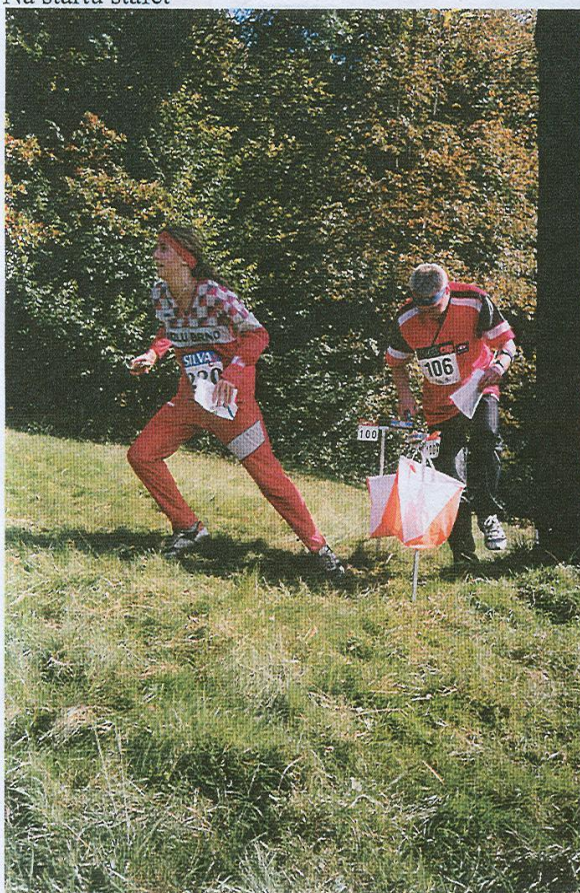
Odběh z kontroly