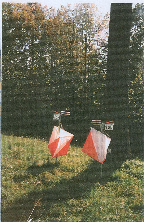
Kontrola během závodu