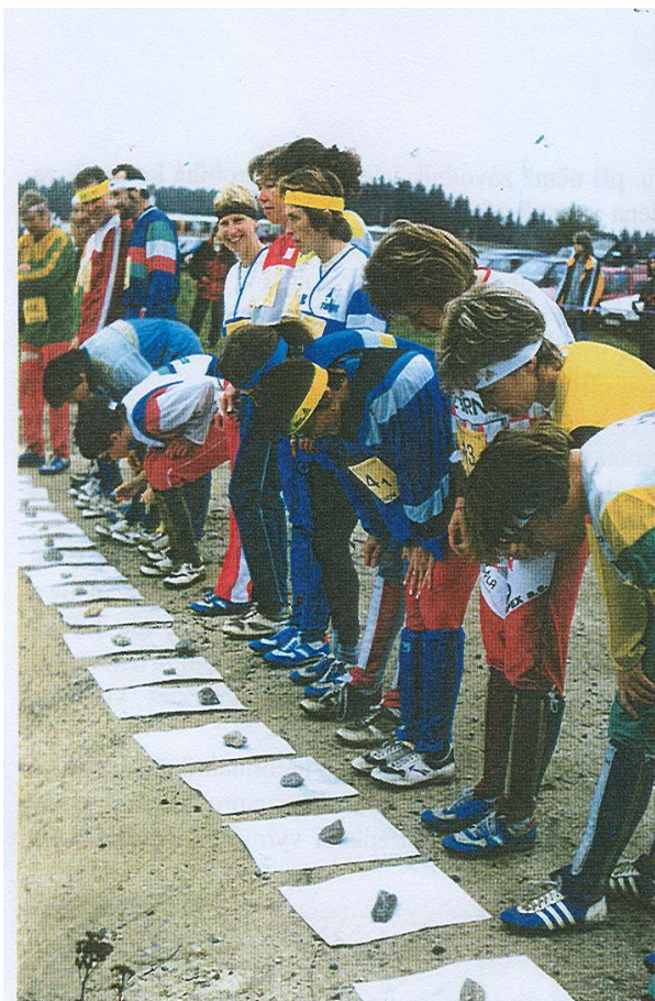
Na startu štafety