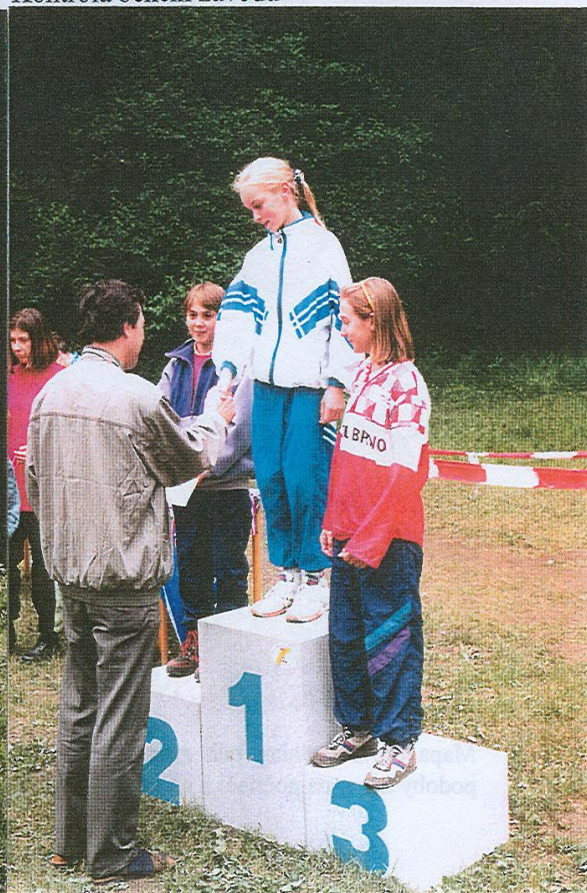
Na stupních vítězů