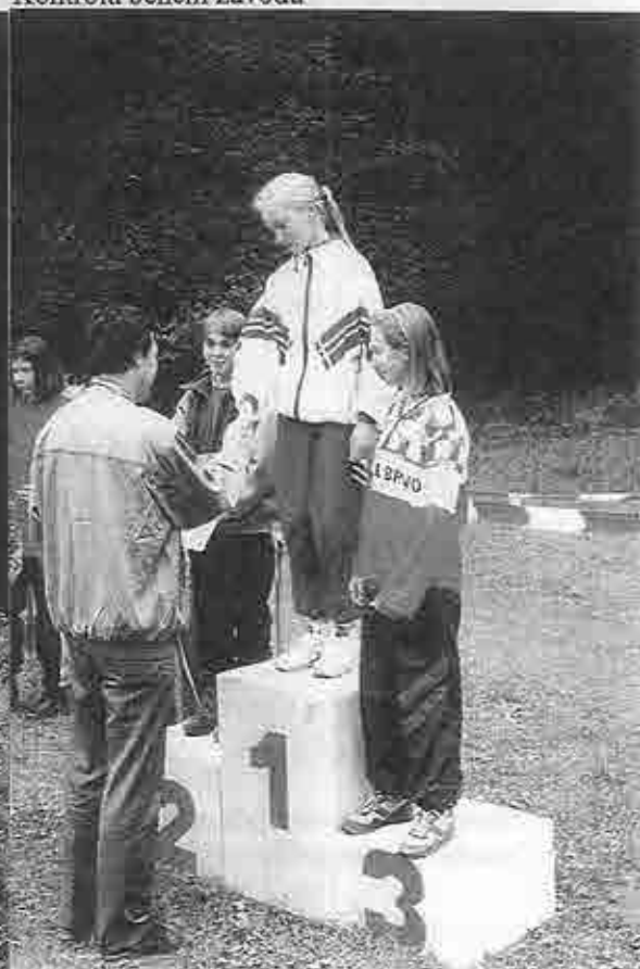
Na stupních vítězů