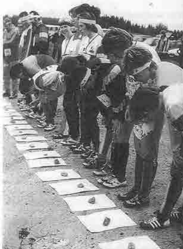
Na startu štafet