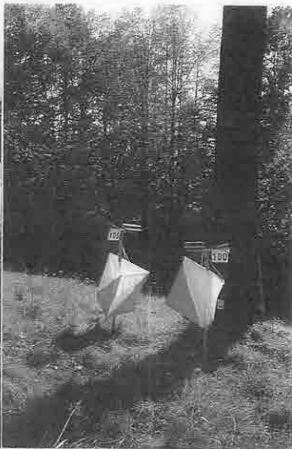
Kontrola během závodu