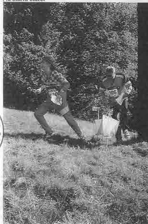
Odběh z kontroly