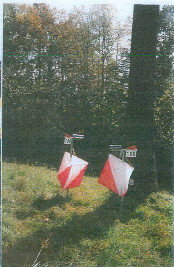
Kontrola během závodu