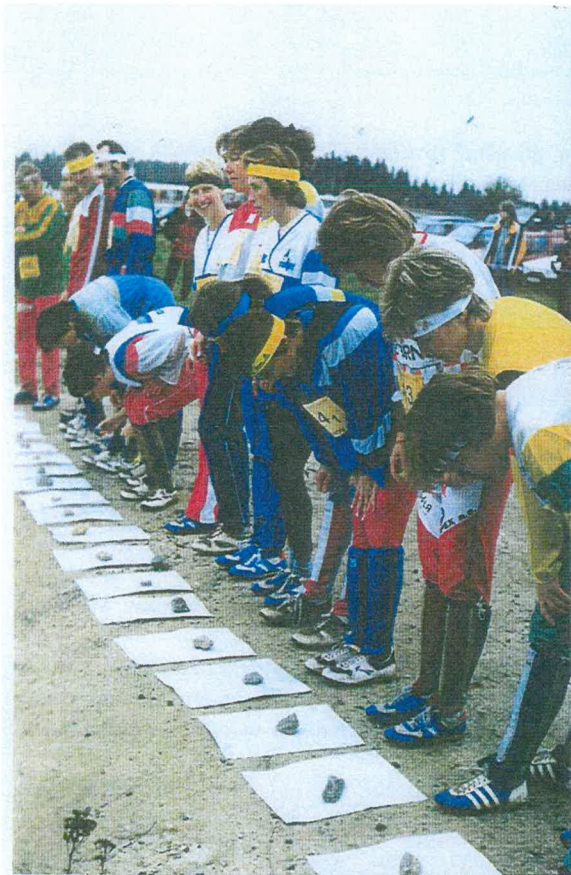
Na startu štafet