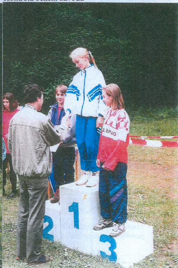
Na stupních vítězů