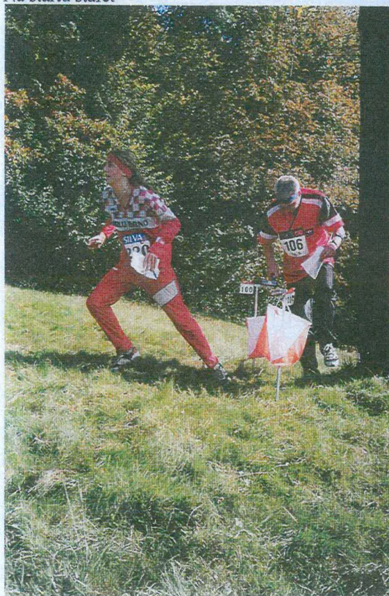
Odběh z kontroly